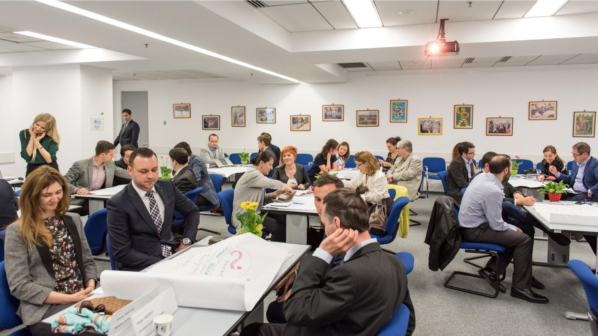
“Changing Finance, Financing Change” Workshop